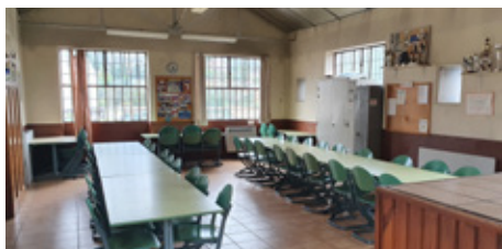
Salle Saint-Julien à Saint-Chamond