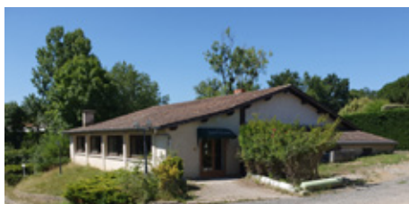
Auberge Le Crin Blanc à Lézigneux