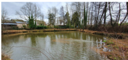
Étang La Gimond