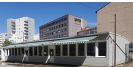
Stade Jean Civier à Saint-Étienne

Contacte le secrétariat des élus à la CMCAS pour demande de disponibilité des locaux et/ou réservation.