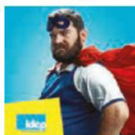
IDCP Prévoyance complémentaire