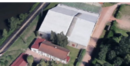
Ensemble sportif Transval à Roanne