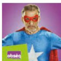
OBSÈQ Couverture obsèques