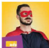
ADP Assurance de prêt immobilier