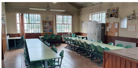
Salle Saint-Julien à Saint-Chamond