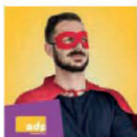
ADP Assurance de prêt immobilier