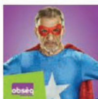
OBSÈQ Couverture obsèques