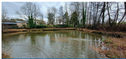
Étang La Gimond