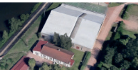
Ensemble sportif Transval à Roanne