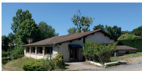
Auberge Le Crin Blanc à Lézigneux