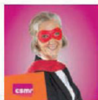
CSMR Couverture supplémentaire maladie des retraités