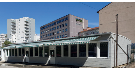
Stade Jean Civier à Saint-Étienne

Contacte le secrétariat des élus à la CMCAS pour demande de disponibilité des locaux et/ou réservation.